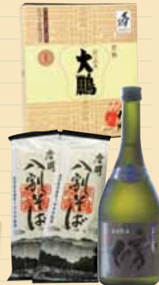
위부터 '다이호 센베이' '마슈 메밀국수(왼쪽)' 마슈 메밀소주 soba(오른쪽)