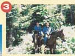
3 30分も馬の背にゆられて慣れば、女性の初心者だって大丈夫!木の枝が張りめぐった木立の中もすいすい切り抜けます。