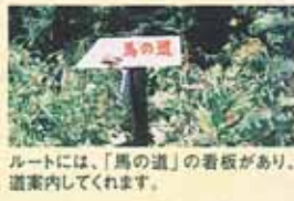
ルートには、「馬の道」の看板があり、道案内してくれます。