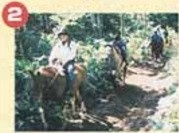
2 途中には斜面30度以上のかなり長い坂もあります。