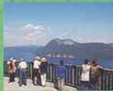
摩周湖第一展望台25分