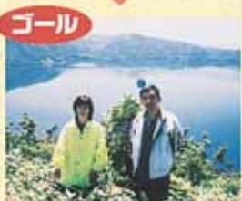
馬から降りたあと、徒歩でここまで登って摩周湖を見た瞬間の感動は、この旅一番の思い出。そして昼食タイム、摩周湖を眺めながら食べるランチはとっても美味しい、30分くらい休憩します。