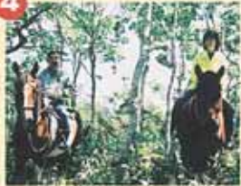
4 今日が初めての初心者でもOK!夏から秋まで、咲き乱れるお花畑の中を通り抜ける場所もあります。