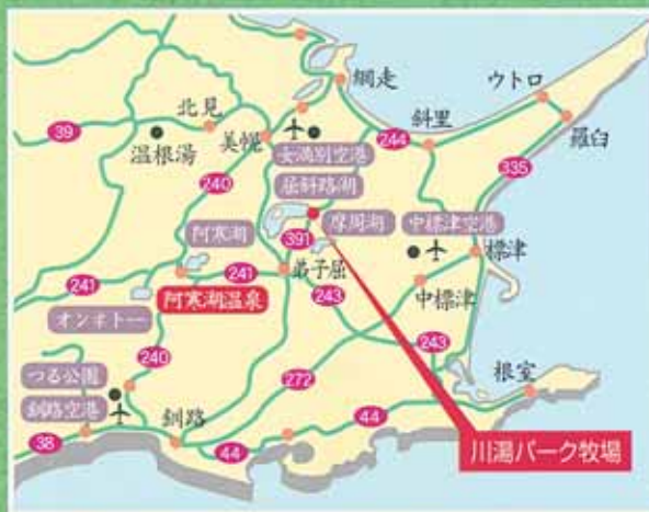
川湯パーク牧場は、摩周湖と后志路湖の間に位置しています。