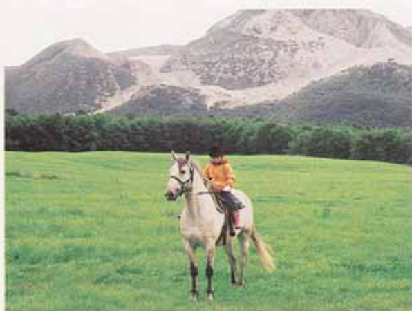
摩周トレッキングコースで 硫黄山をバックにした感動フォトポイント。

広がる大自然の中、 乗馬・ホーストレッキングを 思いきりお楽しみください。 澄んだ空気と爽やかな風。 身体中で自然の気持ち良さを 実感できるはずですよ。