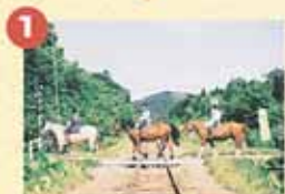
1 ます最初にJF訓練木球の踏みきりを越えます。ワクワク・ドキドキの連続はここから始まります。