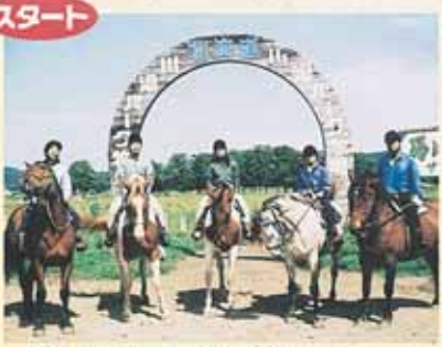
さあ、いよいよ摩周大観望台へのホーストレッキングのスタート!