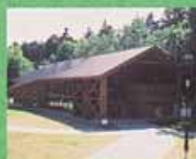
川湯エコミュージアム5分

自然が大好きで、 とことんリフレッシュできる旅行を計画中なら ぜひ、乗馬をプラスしてみてください。 そして観光や自然体験で川湯温泉をたっぷり楽しんで下さい。