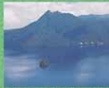
摩周湖第三展望台20分